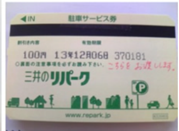
▲ リパークチケット