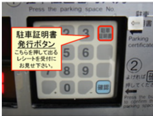
▲ 駐車証明書発行ボタン

コインパーキング（三井のリパーク）に駐車された方は 会計時に駐車証明書を提示してください。 リパークチケットをお渡しします。